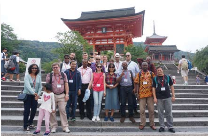
◀京都・清水寺にて

2016年6月に実施された国内研修旅行には、16カ国より奨学者17名の方々が参加されました。