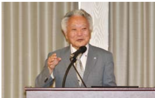
特別講演をされる▶ 家森幸男先生

奨学者（本財団の研究奨励金制度で招聘した外国人研究者）の方々に、本財団の設立目的と事業活動についてより深く理解していただくため、東京ミーティングを毎年実施しております。