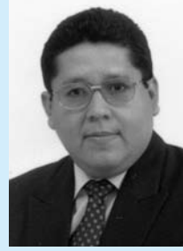
アリスティデス・キンテロ・ルエダ博士 (パナマ)

最後になりますが、松前国際友好財団の創業者、ご賛同者、運営に携わる皆様へ、心から感謝申し上げます。