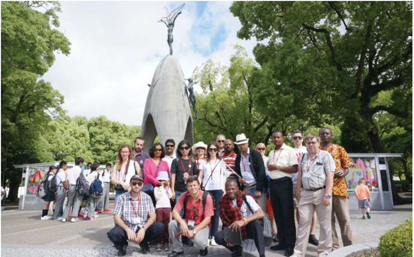
国内研修旅行（2016年6月23日、広島平和公園にて）