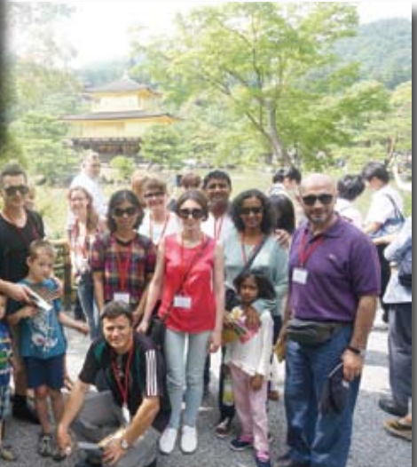
京都・金閣寺にて▲