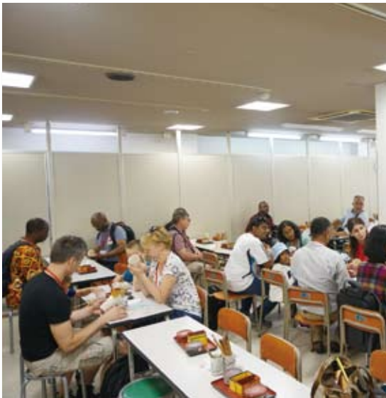
▲湯のみに絵付け体験をする奨学者（京都）