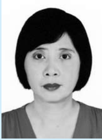
ワー・ワー・アウン博士 (ミャンマー)